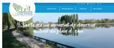
Site internet et logo de la Chesnaie – Prochainement en ligne