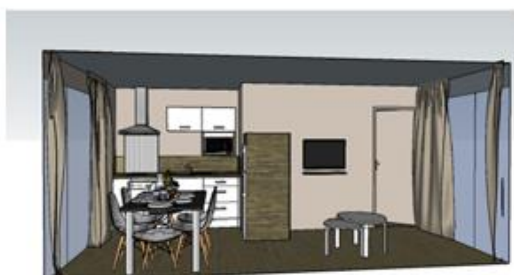
Rénovation du VVNJ