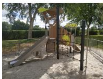
Nouvelle aire de jeu à la Chesnaie