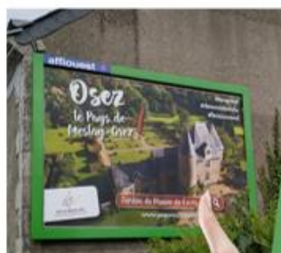
Campagne de communication « Osez le Pays de Meslay Grez »