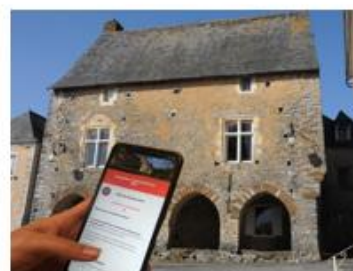
Création et mise en ligne du 1 er parcours Baludik à Chéméré-le-Roi

Synthèse Rapport budgétaire 2021 – Tourisme - Patrimoine PAYS DE MESLAY-GREZ Proche de tout proche de vous